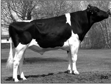
Comestar STORMATIC Plein-frère de LAUSINA