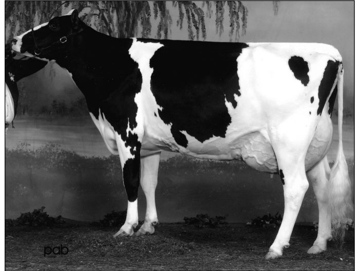
Comestar LAUSINA Storm EX-CAN 4* Une EX-CAN de la famille LAURIE SHEIK !