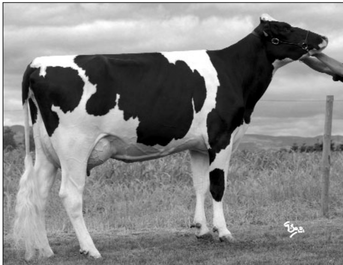
TAÏGA TB-85 NT

Des vaches parfaitement adaptées au contexte actuel !