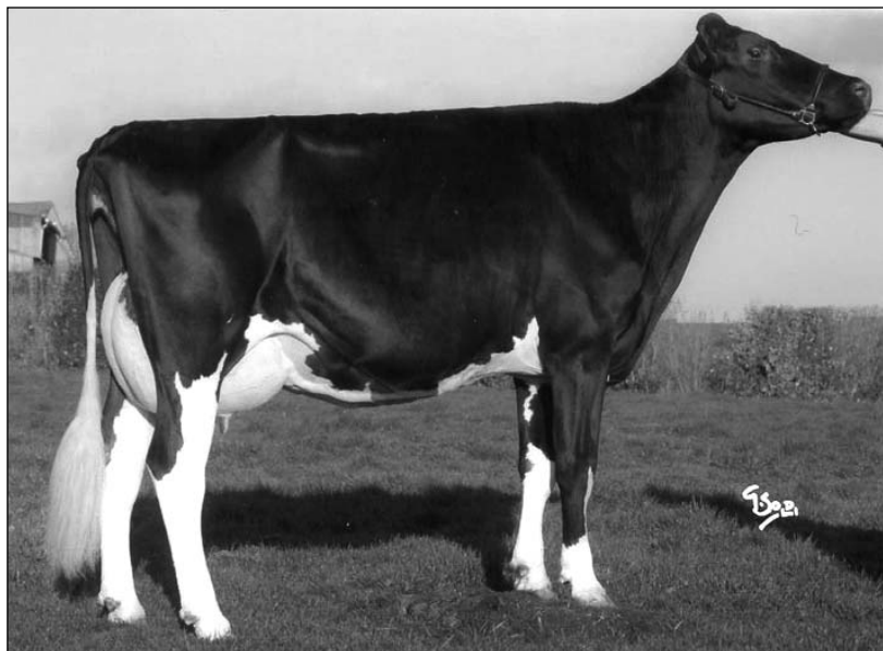
UMEA TB-86 NT